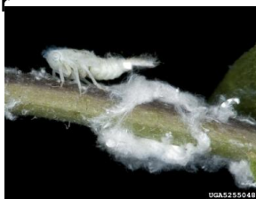
Nymphe de M. pruinosa

On retrouve ce ravageur piqueur-suceur très polyphage principalement dans des vergers. En maraîchage, on l'observe en ce moment sur aubergine où il commence à faire des gros dégâts. Après des interventions phytosanitaires, les parcelles sont très vite recolonisées du fait de l'étalement des éclosions, de la mobilité des larves et des adultes et de leur abondance dans les haies et le maquis. Soyez donc vigilant et concertez vous avec votre technicien avant d'intervenir.