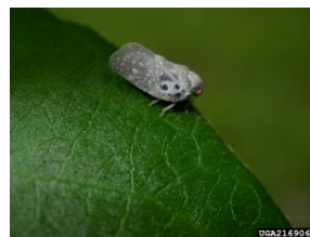
Adulte de M. pruinosa