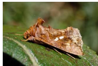
Adulte de Chrysodeixis chalcites