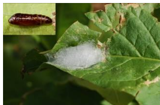
Chrysalide de Chrysodeixis chalcites

Il s'agit d'un ravageur polyphage. Soyez donc vigilant et informez votre techniciens si vous apercevez des chenilles vertes dans vos salades ou sur d'autres cultures.