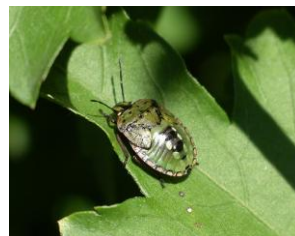
Punaise verte ponctuée; stade juvénile (L5)