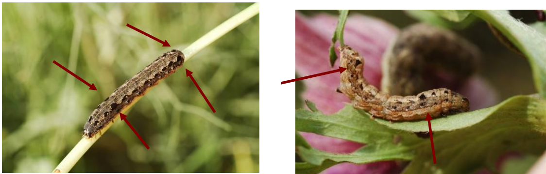
Chenilles de S. littoralis

Un bon moyen de distinguer la noctuelle méditerranéenne des autres noctuelles sont les quatre triangles noirs sur le dos de la chenille: