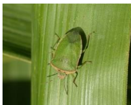
Punaise verte ponctuée; stade adulte

Sur tomate, on observe la présence de la punaise verte ponctuée, encore en stade juvénile, et ces premiers dégâts sur fruits.