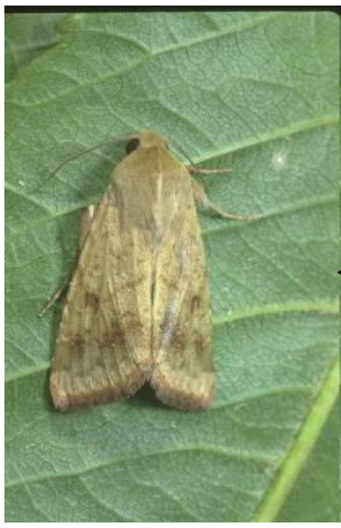
À gauche : Image 5 Adulte de Helicoverpa armigera