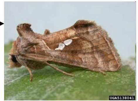
À droite : Image 3 Adulte de Chrysodeixis chalcites