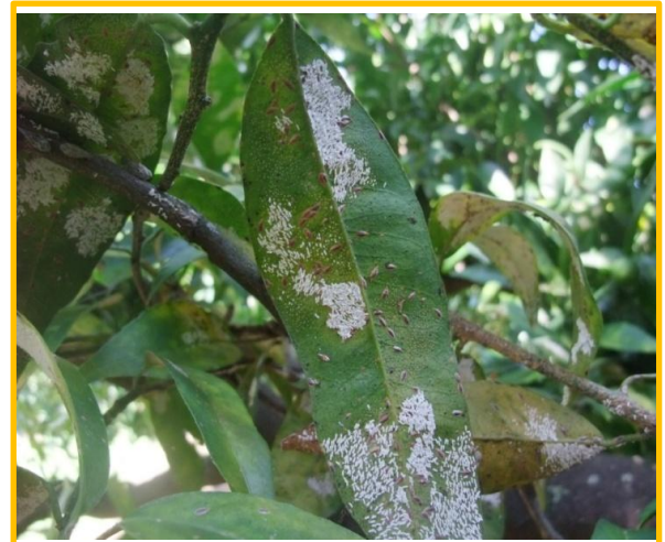
Photo 1 : Boucliers bruns des femelles et puparium blanc des mâles de la cochenille asiatique.

Ce ravageur est présent dans la plaine orientale, entre les communes de Poggio-Mezzana et Santa Maria Poggio ( 14 parcelles infestées). Une forte attaque de cochenilles asiatiques peut provoquer la mort de l'arbre.