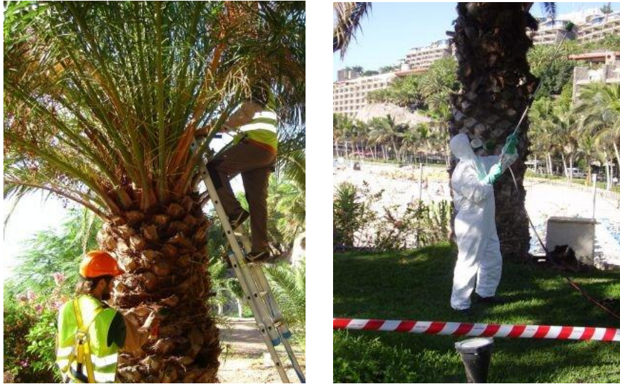
Figure 3: Work Practices on palms and handling of pesticides.