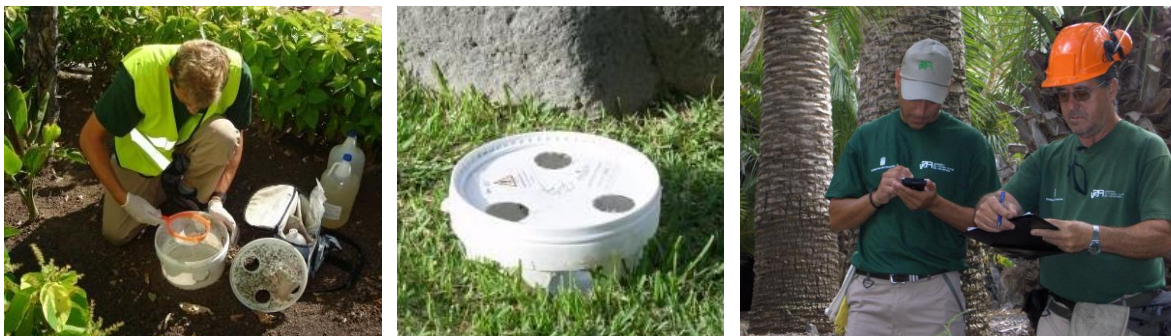
Figure 4: Installation, maintenance and network monitoring trap.