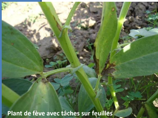
Plant de fève avec tâches sur feuilles

Les conditions climatiques de ces derniers temps étaient peu favorables pour les cultures en place. De fortes pluies, des tempêtes, une baisse de température et même de la grêle ont laissé des traces sur les végétaux.