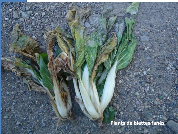
Plants de blettes fanés