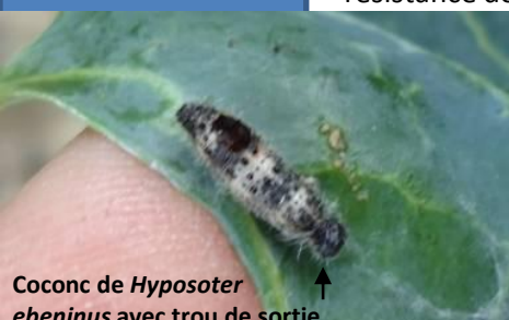
Cocon de Hyposoter ebeninus avec trou de sortie

Chenilles : Sur la parcelle à Biguglia, nous observons une chenille de M. brassicae de 3 cm. 7 salades des 15 observées montrent des traces d'alimentation de chenilles. A Ghisonaccia, nous ne retrouvons pas de chenille vivante mais quatre chenilles de la piéride du chou parasitées. Il s'agit du parasite Hyposoter ebeninus . On observe moins de chenilles depuis deux semaines. Ceci est en partie dû aux températures basses de ces derniers temps. La présence importante d'auxiliaires est une deuxième raison. Le fait que nous ayons toutefois retrouvé une chenille vivante de M. brassicae montre la résistance de cette espèce.