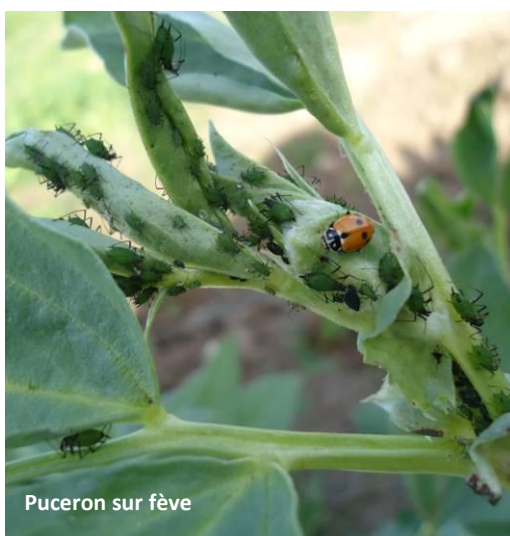
Puceron sur fève

De manière générale, nous observons des foyers de pucerons sur les sites et cultures suivants :