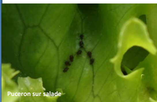
Puceron sur salade

Évaluation du risque : Moyen à Elevé selon les cultures.