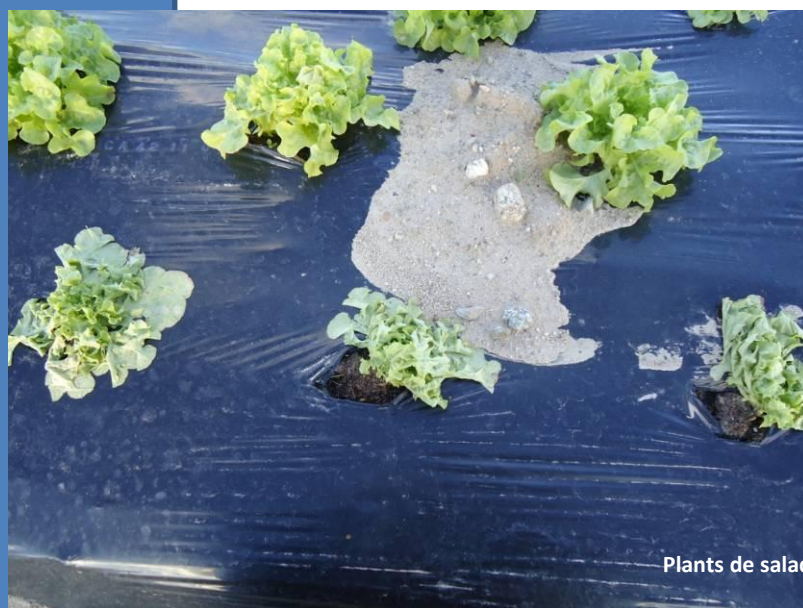
Plants de salade fanés

Sur une parcelle de salade à Ghisonaccia et une parcelle de blettes à Biguglia, nous constatons des plants en train de faner en raison d'un mauvais état des racines. Ce phénomène semble être due à la grande quantité de pluie tombée récemment.