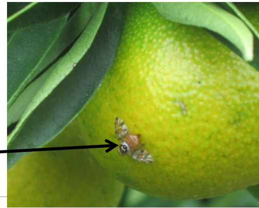
Cératite sur fruit

Évaluation du risque : Faible à moyen ; certaines variétés se colorent (précoces). Il est fortement recommandé d'être attentif à la parcelle et de contrôler vos pièges.