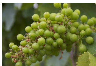
Stade K Petit pois