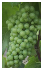
Stade L Fermeture de la grappe