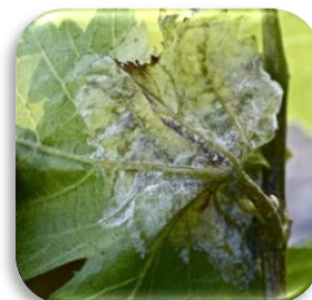
Tâche de Mildiou en cours de sporulation

A Aléria, sur une parcelle de Grenache préalablement touchée les manifestations sur feuilles progressent encore fortement (30% des feuilles atteintes sur 40% des ceps) tandis que les attaques sur grappes sont désormais contenues par les traitements. La présence de mildiou « mosaïque » nous est aussi signalée sur une autre parcelle de Grenache, elle aussi située à Aléria.