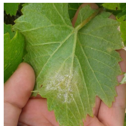
Photo 2 : Sporulation du champignon sur face inférieure des feuilles