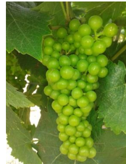
Stade L « fermeture de la grappe »