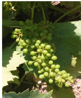
Stade K « petit pois »

La végétation semble avoir un peu d'avance par rapport à l'année dernière.