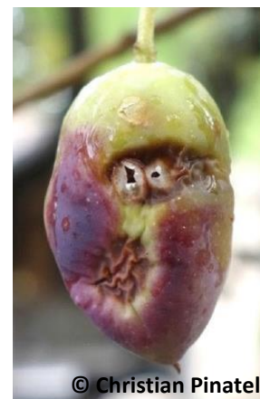
Photo 2 : Olive trouée en train de se nécroser

Ces conditions, conjuguées à de l'humidité liée aux pluies, vont conduire à des altérations de l'olive dommageables à la qualité de l'huile d'olive qui en sera issue (perte de fruité et début d'apparition de défauts : principalement le rance et le moisi).