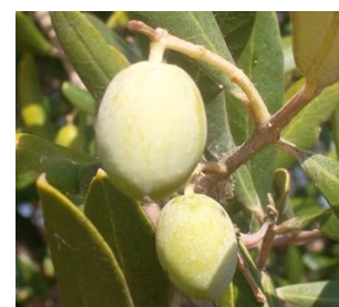
Photo 1 : Olive de variété Sabina devenant vert pâle à jaunâtre (code 80)

D'après l'échelle BBCH des stades phénologiques de l'olivier (Sanz-Cortés et al., 2002) : les fruits ont terminé leur stade de développement et la maturation des fruits a commencé : les fruits vert foncé deviennent vert pâle ou jaunâtres (code 80).