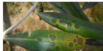
Photo 3 : Taches symptomatiques des contaminations dues au champignon F. oleagineum

Les taches dues aux contaminations du printemps continuent d'apparaître sur les feuilles âgées car les conditions climatiques sont favorables au développement de la maladie. En effet, les symptômes caractéristiques du champignon apparaissent avec des températures comprises entre 11 et 20°C. En deçà de 11°C et au-delà de 25°C le développement de la maladie est ralenti et la durée d'incubation s'allonge. Le temps nécessaire à l'apparition de la tache après la contamination varie donc avec la température.