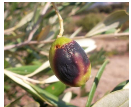
Photo 2 : Dégâts caractéristiques sur olive dus à l'asticot et trou de sortie de l'adulte