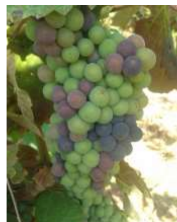
Stade M « Mi - véraison »