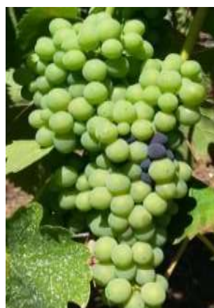
Stade M «Début véraison»