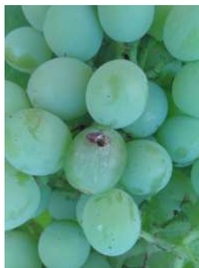
Perforation de baie