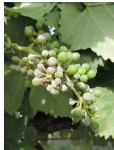
Oïdium sur grappe