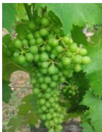
Stade L «Fermeture de la grappe»

La véraison est visible sur Niellucciu dans la plupart du vignoble Corse, sur Pinot Noir en Côte Orientale et Biancu Gentile en Balagne. Quelques baies commencent également à vérer sur Sciaccarellu et Vermentinu dans le Sud de l'île.