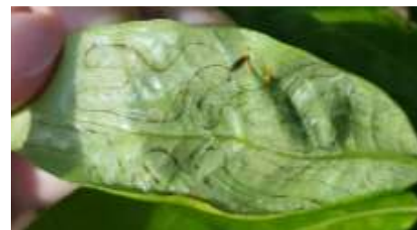
Photo 1 : feuille minée

Gestion du risque : Surveiller l'apparition de nouvelles mines sur les jeunes feuilles