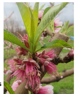
Stade chute des pétales

Stade BC à chute des pétales pour les variétés précoces ; le stade pointe verte n'est pas atteint pour l'ensemble des variétés à ce jour.