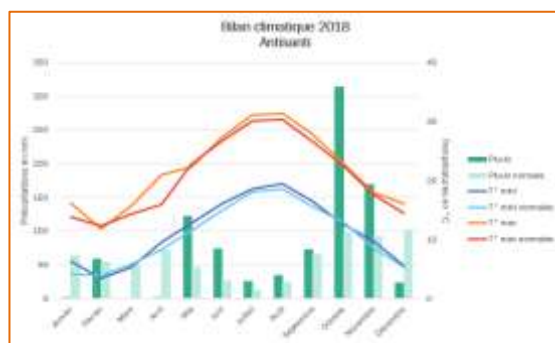
Figure 2 : synthèse climatique 2018 station d'Antisanti