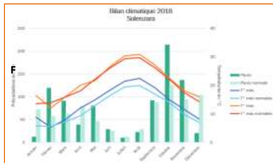
Figure 3 : synthèse climatique 2018 de Solenzara