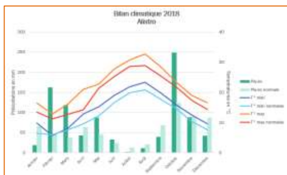
Figure 1 : synthèse climatique 2018 station d'Alistro

L'année 2018 a été une saison assez particulière pour le clémentinier, à la fois favorable pendant les périodes de floraison et de développement du fruit puis très rude au début de la récolte, avec des pluies diluviennes en octobre (Figures 1 à 4).