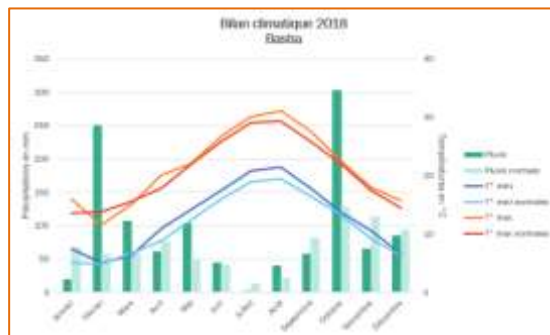
Figure 4 : synthèse climatique 2018 station de Bastia Poretta